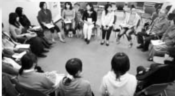
食事指導勉強会の風景